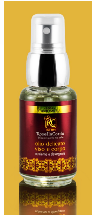
Linea Viso e Corpo Olio Delicato