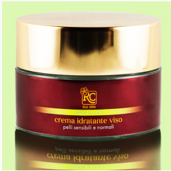
Linea visio : Crema Idratante