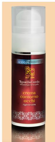
Linea Uomo Crema Viso Occhi