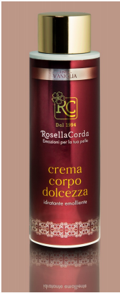
Linea corpo : Crema Dolcezza