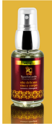
Face & Body Line Delicate Oil