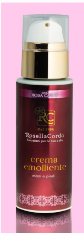
Hands & Feet Line Emollient Cream