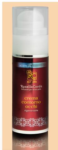
Men Line Contour Cream Eyes