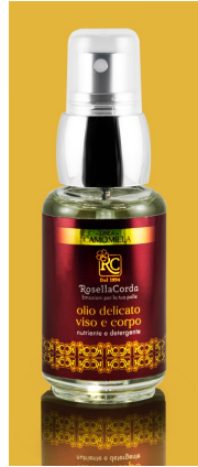
Ligne Visage & Corps Huile Delicate