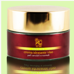
Ligne Visage : Crème Hydratante