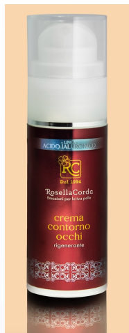
Ligne Homme Crème Contour des Yeux