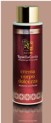
Ligne Corps : Crème Douceur