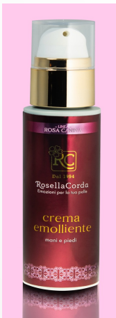
Ligne Mains et Pieds Crème Emolliente